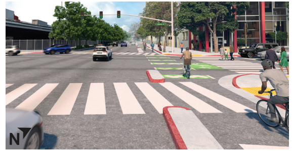
效果圖: Webster街與六街交會