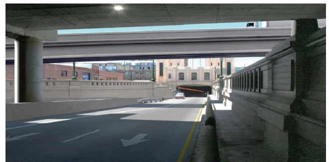
重建的Posey过海隧道出口效果图