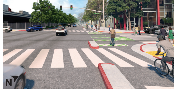
عند شارع Webster 6 التسليم: شارع