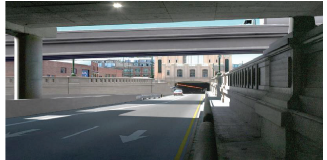
المعاد بناؤه Posey تسليم مخرج نفق