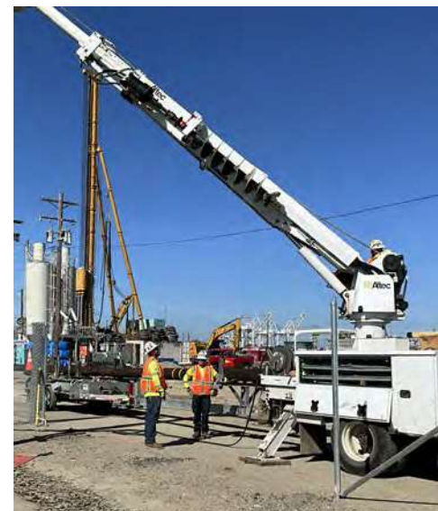
Esta grúa blanca se está utilizando para instalar un nuevo poste eléctrico de 15 kilovoltios (15,000 voltios).