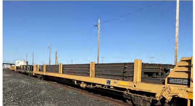
Entrega de nuevos rieles en el sitio de trabajo.