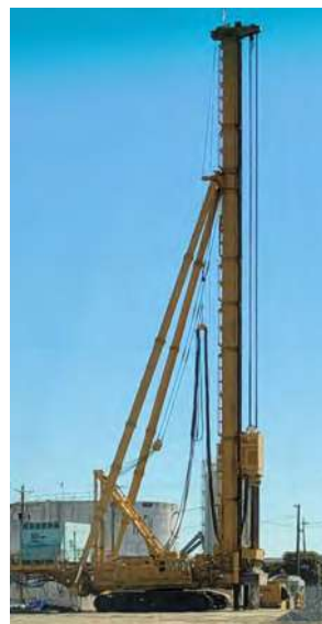
La "Big Bird", ya ensamblada, excava agujeros profundos para insertar en el suelo refuerzos de acero y pilotes de hormigón.