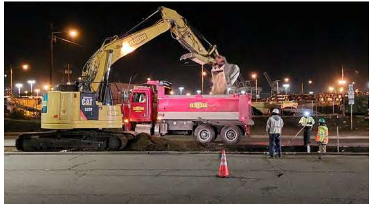
Se utilizan una excavadora y un camión de volteo para instalar y conectar nuevas tuberías de desagüe pluvial.