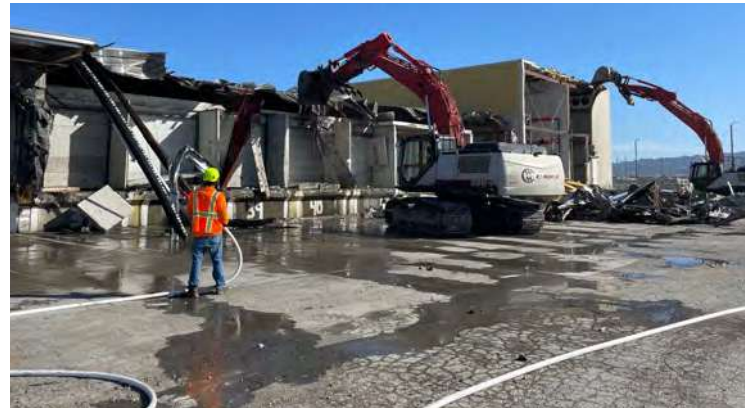
La demolición del antiguo edificio de PCC Logistics en el Puerto de Oakland está abriendo paso a la nueva vía de 7th Street

Información actualizada sobre GoPort, panorama general, hojas informativas, etc.