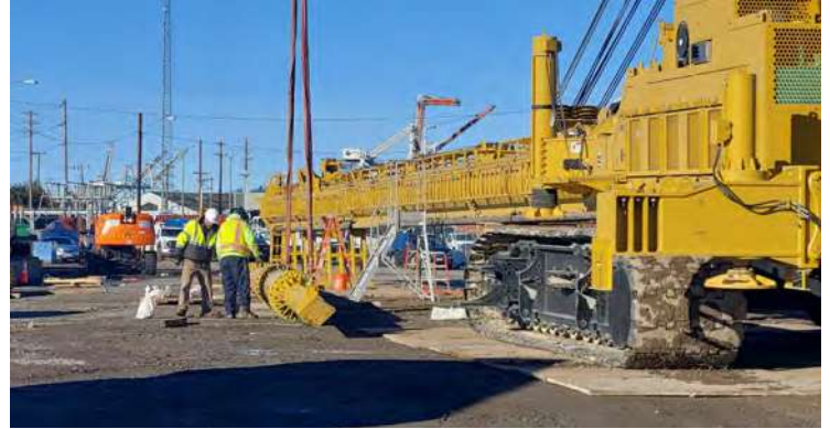
Antes de la construcción, se está ensamblando una enorme plataforma de perforación apodada "Big Bird".