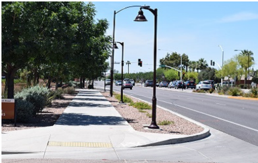
Iluminación a escala peatonal