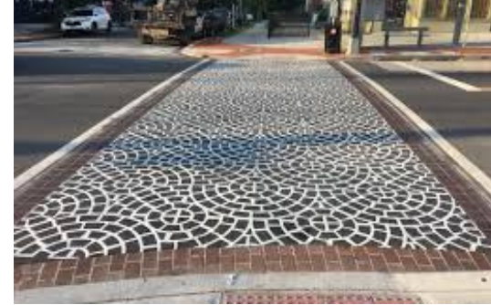
Cruces peatonales de alta visibilidad