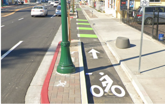
Carriles para bicicletas protegidos