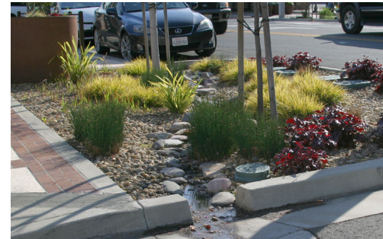
Jardines pluviales y plantas tolerantes a la sequía