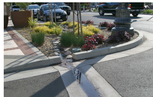
雨水花园和耐旱植物