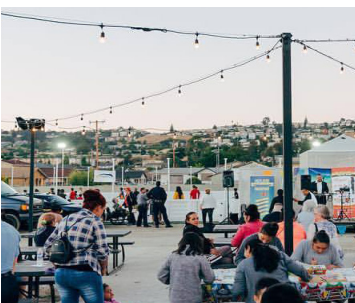
Eden Night Live 活动：Ashland