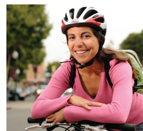
La Medida B financia las calles y caminos locales y los servicios de transporte público, mejora la seguridad de los peatones y de los ciclistas, proporciona un mejor acceso para las personas mayores y las personas con discapacidad y mejora la eficiencia de las carreteras.