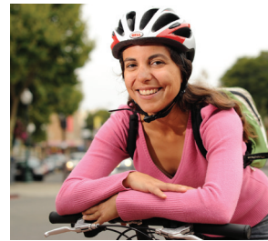
「Measure B」為本地街道、道路和公共交通服務、自行車和行人安全專案、為老年人和殘障人士提供更好的便利通道以及公路改建等事業提供資金。